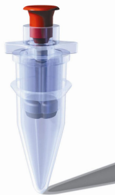
Capillette i provrör

Reagenspatronen Capillette innehåller en färdigdoserad uppsättning analyskemikalier (i fyra kamrar) och fungerar samtidigt som lock på provröret. Capillette eliminerar behovet av manuell dosering med pipett eller automatisk pipettering. De fyra reagenskamrarna töms genom en knapptryckning följt av centrifugering, såsom vid en PCR-analys i QuanTyper, eller genom separat centrifugering av proverna. Capillette möjliggör en snabb, enkel och exakt dosering av reagenskemikalierna.